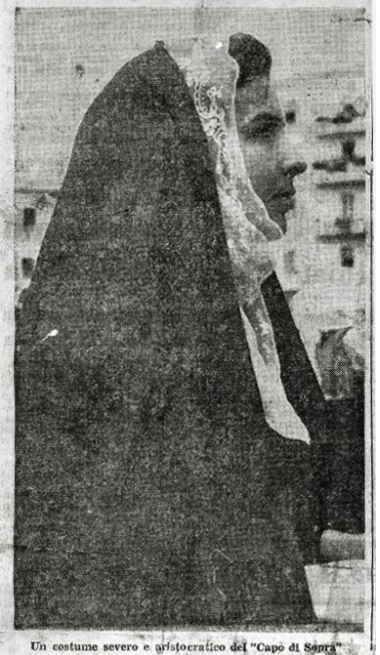
Un costume severo e aristocratico del "Capò di Sogrà"

Visitare la Sardegna per scoprire tutto un mondo d'ignorate bellezze